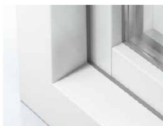
Schüco LivIng Variant HVL met een 15° als onderste kader en 6° als zijkader

Het kunststof systeem Schüco LivIng Variant is een innovatief 6-kamersysteem. Het systeem staat garant voor onovertroffen thermische isolatie en smalle aanzichtbreedtes. Bovendien zorgt de verhoogde constructie diepte voor meer veiligheid, zodat het hangen en sluitwerk ver naar binnen ligt en inbrekers weinig houvast hebben om toe te slaan.